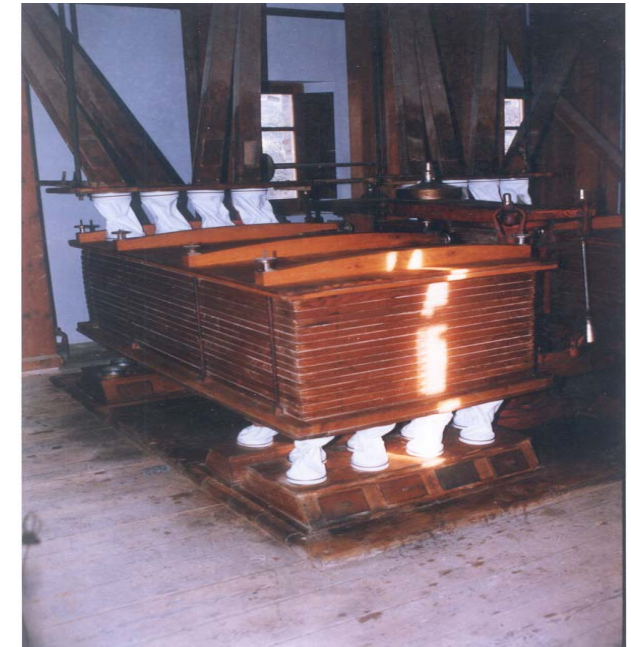
Llegenda foto: El planxista és una de les màquines més característiques de la Farinera

maquinaria, mereixen la nostra atenció tant per entendre bé el procés de la farina com per el bon estat en que es troben.